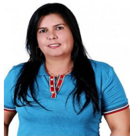
Izabella Antunes de França Vice-Prefeita